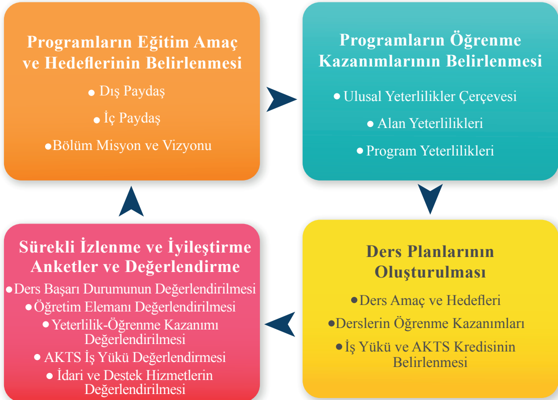
Şekil 1. Program iyileştirme adımları

Program yeterliliklerinin güncellenmesi için programların sürekli bir değerlendirme sürecine tabi tutulması gerekir. Genellikle son sınıfın son döneminin değerlendirme için en uygun zaman olduğu düşünülmektedir; çünkü bu dönemde öğrencilerin kazanacakları bilgi, beceri ve yetkinlikleri en yüksek düzeyde tespit etmek mümkündür. Program değerlendirilirken öğrenciye araştırma makalesi yazdırma, bitirme tezi veya ödevi hazırlatma, öğrencinin başka öğrencilerin makale veya tezlerini değerlendirme, yeni ve daha eski mezunlara anket uygulama, kamu ve özel sektör temsilcilerine anket uygulama veya bu kişilerle derinlemesine görüşmeler yapma, uygulamalar sırasında gözlem yapma, periyodik olarak düzenli müfredat geliştirme, öğretim üyesi/öğrenci hareketliliği ile geri bildirimler alma vb. bir çok teknik ve yöntemlerden yararlanılabilir. Ayrıca mezunlar, iş verenler, meslek odası temsilcileri ve danışma kurulu gibi dış paydaşlar ile öğretim elemanları, bölüm personeli ve öğrenciler gibi iç paydaşların bu sürece katılması sağlanmalıdır. Bu kapsamda program iyileştirme adımları genel yapısı Şekil 1’de verilmiştir (2).